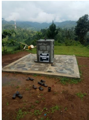
Gambar 2 Tugu Triangulasi

Sedangkan puncak Triangulasi di Desa Sawangan cukup menarik, karena nama “Triangulasi” sendiri berasal dari kata “triangulasi”. Tugu Triangulasi pada zaman pemerintahan Hindia Belanda, digunakan mencari tempat yang paling tinggi untuk menentukan arah mata angin, untuk mencari titik koordinat dihitung menggunakan hukum Sinus.