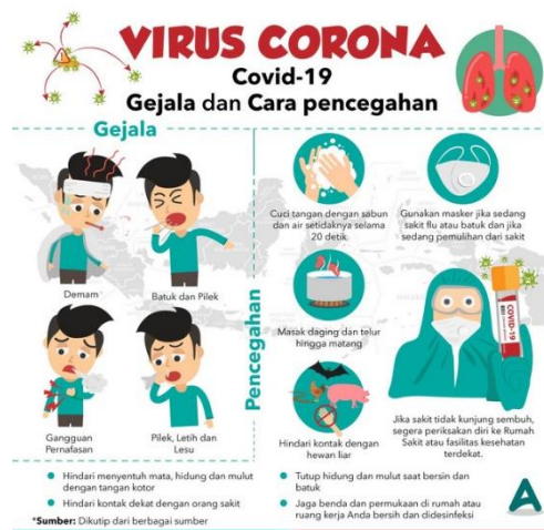
Gambar 3. Poster gejala dan pencegahan covid-19. 6

Hasil rerata pretest kelompok 1 sebesar 78.3, kelompok 2 sebesar 65.7, dan kelompok 3 sebesar 78.3 sedangkan rerata posttest kelompok 1 sebesar 71.4, kelompok 2 sebesar 75.7, dan kelompok 3 sebesar 84 (gambar 4). Terdapat peningkatan nilai pada kelompok 2 sebesar 10point dan kelompok 3 sebesar 5.7 point. Hal ini menunjukkan adanya peningkatan pengetahuan peserta perihal materi edukasi melalui poster. Berbeda halnya dengan kelompok 2 & 3, terdapat penurunan nilai sebesar 6.9point pada kelompok 1, hal ini kemungkinan disebabkan sebagian peserta kurang memahami kalimat pada lembar pretest dan posttest karena keterbatasan baca tulis pada kelompok 1. Adapun kegiatan dapat dilihat pada gambar 5.