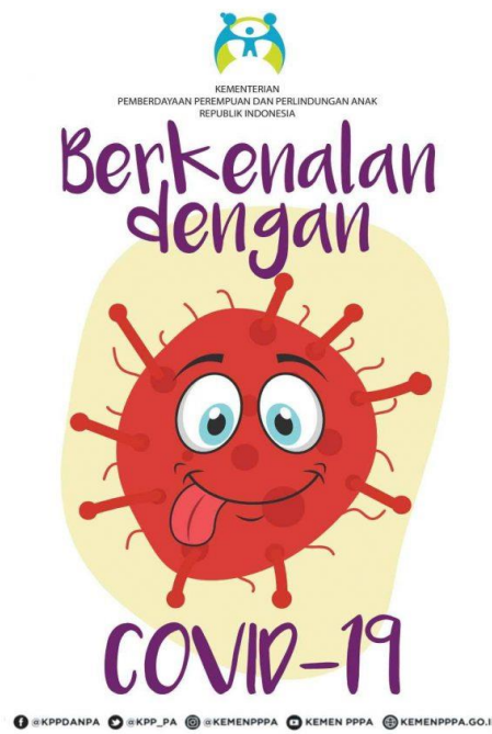
Gambar 2. Poster Berkenalan dengan covid-19 5