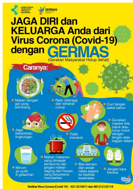
Gambar 1. Poster Jaga diri dan keluarga dari virus covid-19 4

Materi edukasi ini meliputi 1). Jaga diri dan keluarga dari virus covid-19: makan dengan gizi seimbang, rajin olah raga dan istirahat cukup, cuci tangan dengan sabun, jaga kebersihan lingkungan, tidak merokok, gunakan masker atau tutup mulut menggunakan lengan atas bagian dalam jika batuk, minum air putih 8 gelas/ hari, makan masakan yang dimasak sempurna, bila demam dan sesak nafas segera ke fasilitas Kesehatan, dan jangan lupa berdoa (gambar 1); 4 2). Berkenalan dengan covid-19 (gambar 2); 5 3). Virus corona covid-19 gejala dan pencegahannya (gambar 3). 6