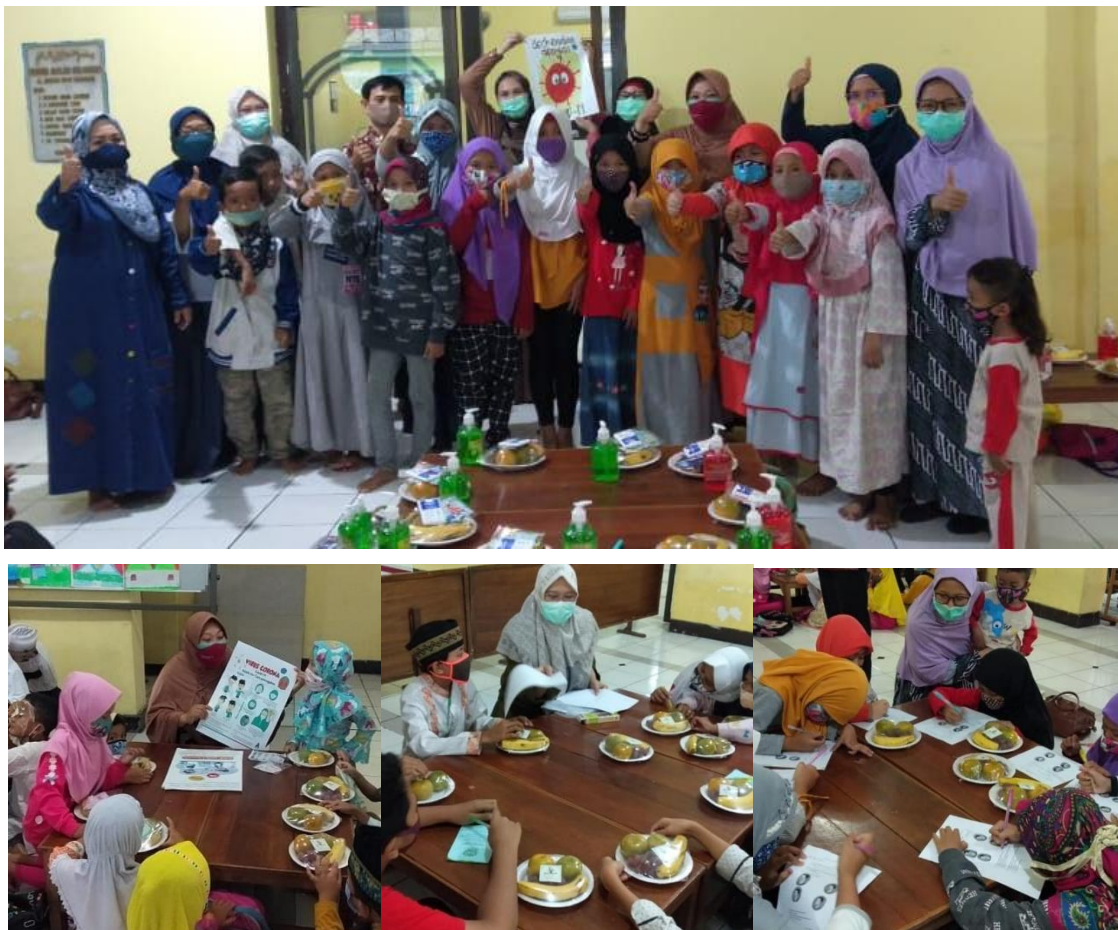
Gambar 5. Foto kegiatan