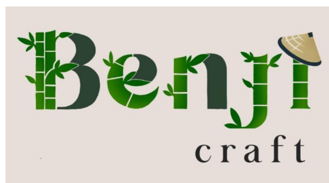
Gambar 3: Label Produk BENJI Craft

Selain itu, untuk meningkatkan penjualan, pada kegiatan PKM ini juga dilakukan pembuatan Showroom BENJI Craft Store di Dusun Bendo, dan juga pada