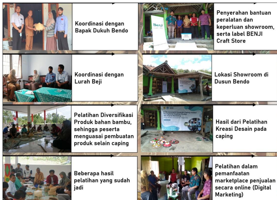
Gambar 2: Kegiatan PKM di Dusun Bendo

Pada rangkaian kegiatan PKM ini Tim Pengabdian juga memberikan pelatihan untuk pembuatan label produk, agar produk yang dihasilkan dapat lebih dikenal luas oleh masyarakat. Label untuk produk mitra tersebut bernama BENJI Craft, disajikan pada Gambar 3, yang berarti kerajinan yang berasal dari daerah Bendo Beji (Benji). Selain itu, untuk meningkatkan penjualan, pada kegiatan PKM ini juga dilakukan pembuatan Showroom BENJI Craft Store di Dusun Bendo, dan juga pada media sosial serta market place .