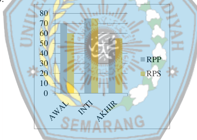
Gambar 3. Diagram Batang Perbandingan Keterampilan Komunikasi pada RPP dan RPS

Analisis RPS ini bertujuan untuk mengetahui bagaimana perbandingan rencana awal proses pembelajaran dengan pelaksanaan pembelajaran yang telah dilaksanakan sehinggadapat diketahui keterampilan komunikasi yang terjadi. pada analisis RPS ini, akan dilakukan perbandingan yang terdapat dalam RPP dengan pelaksanaan pembelajaran yang terjadi di dalam kelas. perbandingan tersebut akan disajikan dalam gambar 3.