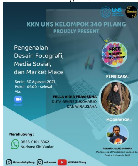
Gambar 3. Penyuluhan Desain Fotografi, Media Sosial, dan Market Place