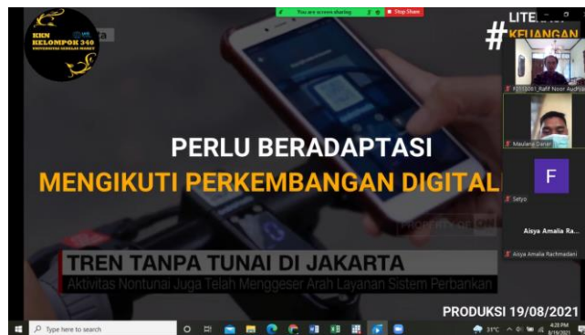
Gambar 1. Pelaksanaan penyuluhan penggunaan E-Money

mereka. Program ini melibatkan warga RT. 23, RW. 04, Desa Pilang dan sekitarnya, terutama pada generasi muda yang sedang mengembangkan usaha mereka. Dengan adanya penyuluhan tentang penggunaan E-Money ini, masyarakat akan menjadi lebih mudah dalam mengelola uang maupun melakukan transaksi elektronik dalam usaha mereka. Terlebih lagi dalam masa pandemi seperti ini, banyak orang yang lebih memilih untuk menggunakan E-Money sebagai media transaksi yang lebih aman dalam berbelanja. Program kerja ini berjalan sangat lancar dan mendapatkan respon baik dari masyarakat. Dengan adanya penyuluhan tersebut, warga menjadi lebih mengerti dan lebih paham mengenai tata cara bertransaksi secara online.