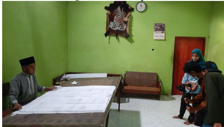
Gambar 4. Pengambilan video proses batik