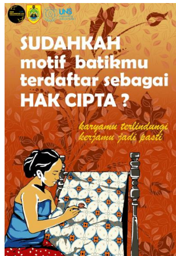
Gambar 2. Penyuluhan Hak Cipta dan Perlindungan Desain Motif Batik